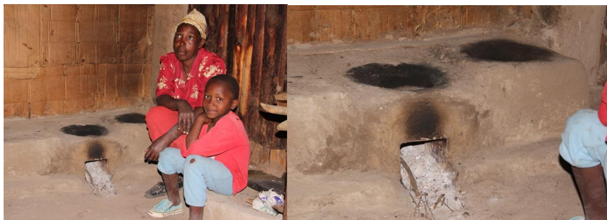
Kein Rauch mehr!