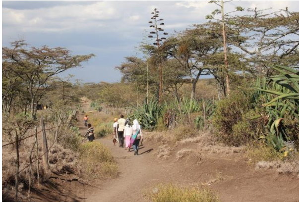
Weite Wege von Haus zu Haus

Wir haben es genossen, durch die Wanderungen von Haus zu Haus etwas Bewegung zu bekommen. Für unsere Ofenbauer bedeuten die weiten Wege zwischen den Anwesen jedoch harte Arbeit und Zeitverlust. Abhilfe war schnell gefunden: Für unsere aktivsten vier Ofenbauer beschafften wir Fahrräder, landesüblich mit stabilem Gepäckträger für den Transport von Werkzeug und der Eisenteilen. Die Anschaffung wird sich bald amortisieren, sind doch die Ofenbauer jetzt in der Lage, in derselben Zeit viel mehr Öfen zu bauen.