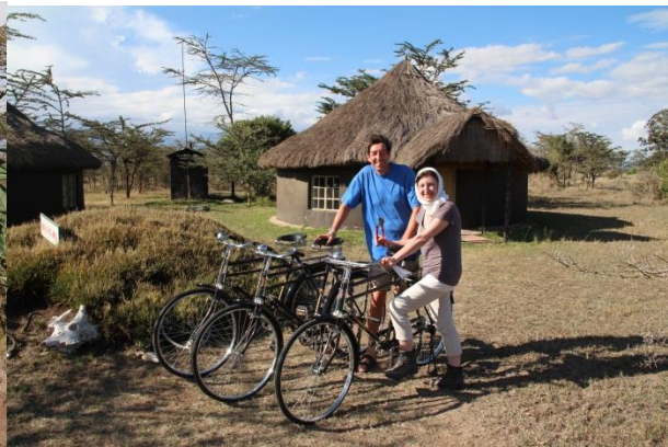
Fahrräder für die Ofenbauer

Der hier vorkommende Boden – Black Cotton Soil – ist für den Ofenbau nicht so gut geeignet wie nepalesischer Lehm Boden, was zu Lasten der Langzeit-Festigkeit geht. Inzwischen läuft ein Testbetrieb mit Einsätzen aus gebranntem Ton. In einer Gegend, in der tonhaltige Erde praktisch nicht vorkommt, ist es schwierig, einen Lieferanten zu finden. Es gelang uns schließlich, im etwa 50km entfernten Nyeri eine Initiative ausfindig zu machen, die die lokalen Tonvorkommen für eine Töpferei nutzt. Die ersten 10 Prototypen wurden kurz nach unserer Abreise geliefert und sind inzwischen eingebaut.