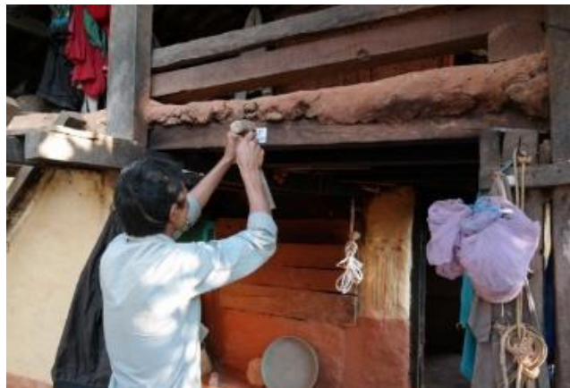
Die Ofen-Nummer wird am Haus befestigt

Dolakha, Ramechhap und Kavre , unser Gebiet im Osten, in dem das Klimaschutz Projekt angesiedelt ist, wurde ja vom Erdbeben 2015 schwer betroffen. Die Aufbauarbeiten gehen eigentlich bisher nur in Dolakha voran. Dort sind die meisten Häuser total zerstört gewesen, inzwischen konnten etwa 1000 Häuser und damit Öfen aufgebaut werden. In Kavre und Ramechhap haben die Regierungsbeamten oft nur Teilzerstörungen bescheinigt, womit die ohnehin minimale finanzielle Unterstützung weiter reduziert wird. Das hat zur Folge dass die Menschen sich in den beschädigten Häusern einrichten, notdürftig reparieren und sich mit der Situation abfinden. Offizielle Zahlen sagen, dass auch 2 Jahre nach dem verheerenden Beben bei 85% der zerstörten Häuser der Wiederaufbau noch nicht begonnen hat. Unsere Ofen-