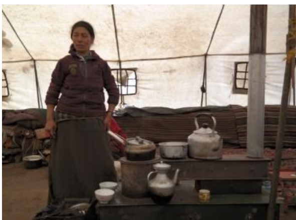
Mustang: Metallofen in einer Jurte

Eine zweite Reise führte mich im Frühsommer in das Entlegene Königreich Mustang, heute ein Teil Nepals. Neuland für mich als Nepal-Kenner! Mit zwei Freundinnen und professioneller Begleitung, verbrachten wir fast drei Wochen in dem kargen Hochtal hinter der Kali Ghandaki Schlucht, und erlebten die Maskentänze der buddhistischen Mönche aus Anlass des Tiji Festivals in Lo Mantang mit. Unvergessliche Landschaftseindrücke wechselten mit mächtigen Klosterbauten und oasenartigen Dörfern ab. Für Geologen ist dieses Gebiet wie ein offenes Buch der Erdgeschichte und auch wir betätigten uns als fleißige Sucher nach Versteinerungen