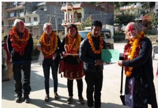
Überreichung der Zertifikate an die Ofenbauer

Eine Projektreise in das Gebiet wurde im November durchgeführt. Dabei konnten 20 Ofenbauer ihre Zertifikate (nach 150 gebauten Öfen) empfangen. Eine ausführliche Diskussion mit den aktiven Frauen und Männern, die vor Ort die Arbeit leisten, war sehr aufschlussreich und zeigte die enge Zusammenarbeit mit den örtlichen Behörden auf. Zur Sprache kamen auch die Schwierigkeiten, denen die Ofenbauer ausgesetzt sind, wenn sie „zu Gast“ in den Dörfern sind. Nicht immer ist die Überzeugungsarbeit über die Vorteile der rauchfreien Küche einfach und erfolgreich. Es gab auch die Gelegenheit, den Aufbau eines Ofens von Beginn bis Fertigstellung zu beobachten. Die Ofenbauer arbeiten nach dem theoretischen Training bis zur Anzahl von 150 Öfen unter der Supervision eines erfahrenen Kollegen, und das wurde uns eindrucksvoll vorgeführt. Anschließend besuchten wir noch einige Haushalte und konnten mit den Hausfrauen ihre Erfahrungen mit dem Ofen diskutieren.