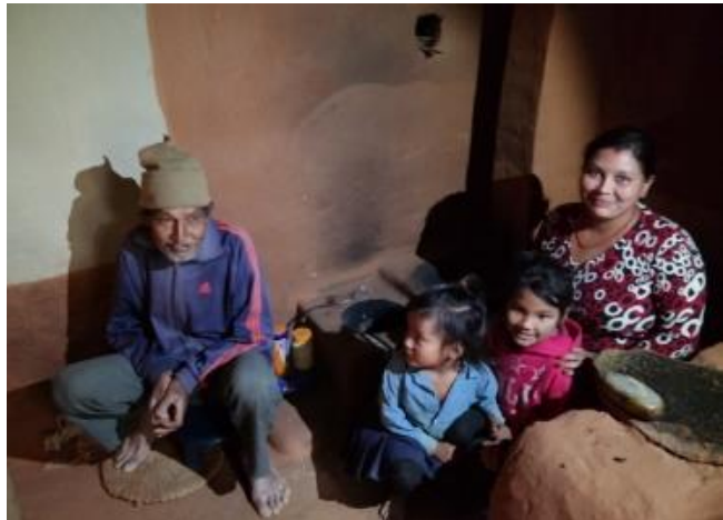
Familie mit neuem Ofen in Pyuthan

Pyuthan: In dem Nachbarbezirk von Gulmi nahm der Ofenbau Fahrt auf. Nachdem es zu Beginn einige Hindernisse zu überwinden galt, konnten im vergangenen Jahr dort wieder über 9000 Öfen gebaut werden. Allerdings musste der Projektzeitraum um ein halbes Jahr verlängert werden, da durch die inaktiven Wahlphasen die geplante Ofenzahl von 23.000 für Pyuthan noch nicht erreicht wurde.