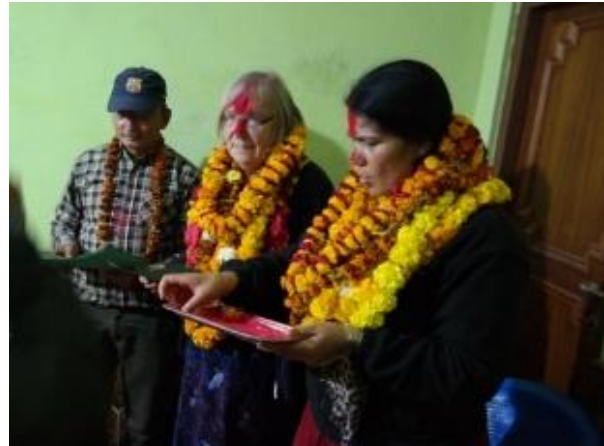
Begrüßung in Pyuthan