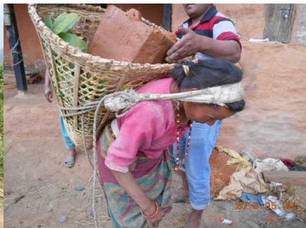
Transport mit dem Doku